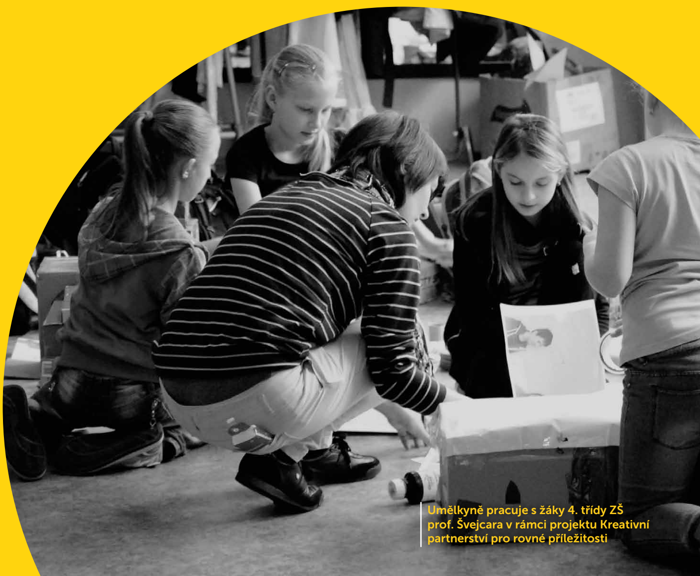
Umělkyně pracuje s žáky 4. třídy ZŠ prof. Švejcara v rámci projektu Kreativní partnerství pro rovné příležitosti

Pilotní projekt je tedy příslibem dalších zásadních dopadů nejen na děti se speciálními vzdělávacími potřebami, nýbrž na celou třídu, včetně učitele, umělce a konzultanta kreativity. Program Kreativní partnerství pro rovné příležitosti nabízí školám funkční systém, který podporuje rozvoj žáků se SVP i ostatních žáků, jejich motivaci a zájem o vzdělávání, rozvoj jejich klíčových kompetencí, podporuje efektivní učení a rozvíjí pozitivní klima třídních kolektivů.