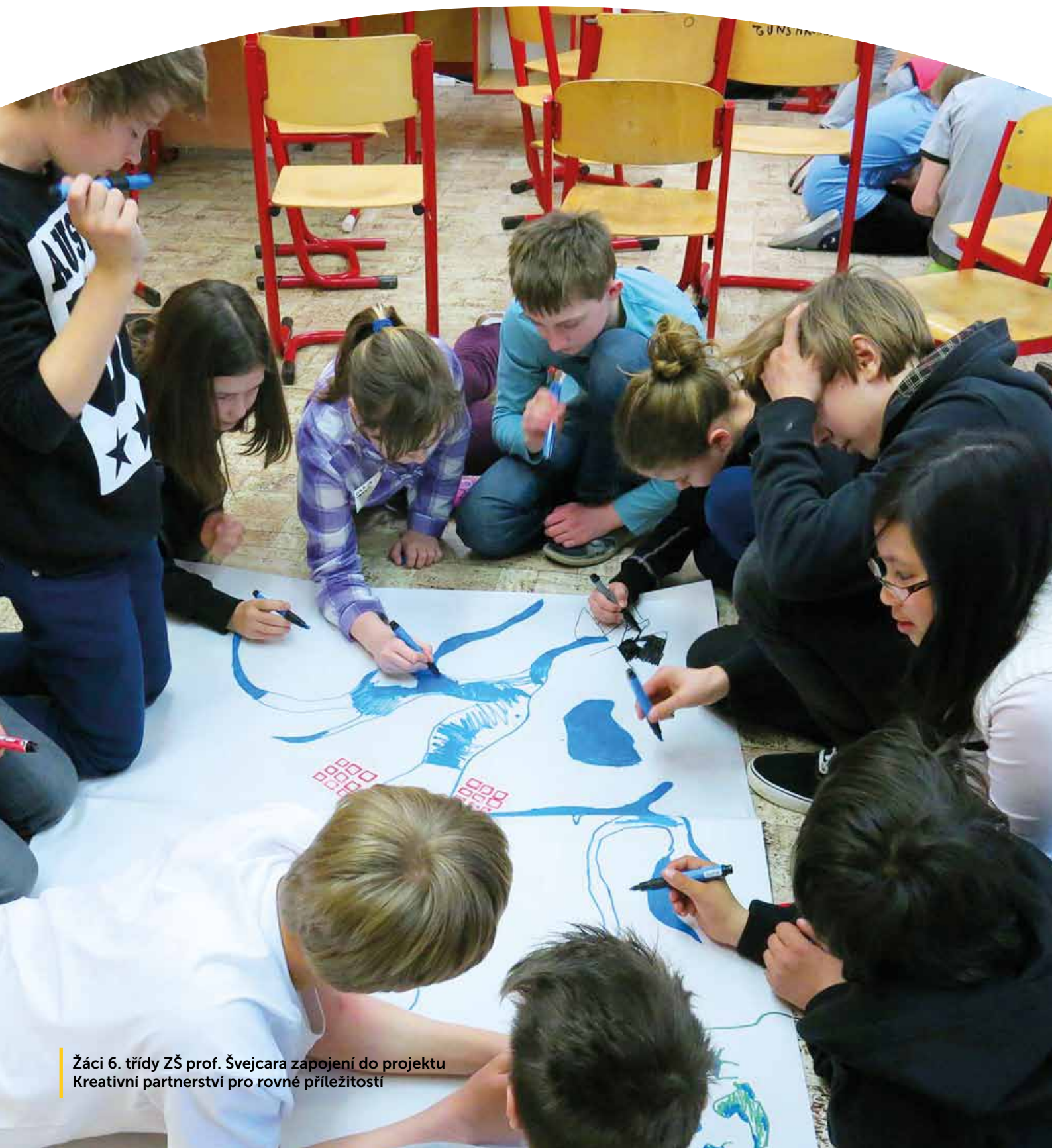
Žáci 6. třídy ZŠ prof. Švejcara zapojení do projektu Kreativní partnerství pro rovné příležitosti

V několika třídách žáci explicitně při evaluaci nebo v rozhovorech s rodiči zmínili zlepšení vztahů s učitelem jako jednu ze změn v rámci projektu. Je logické, že díky ozvláštňení výuky a větší zaangażovanosti v daném předmětu, může dojít k proměně vztahů s učitelem.