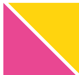
Práce žáků 4. třídy zapojených do projektu Kreativní partnerství pro rovné příležitosti