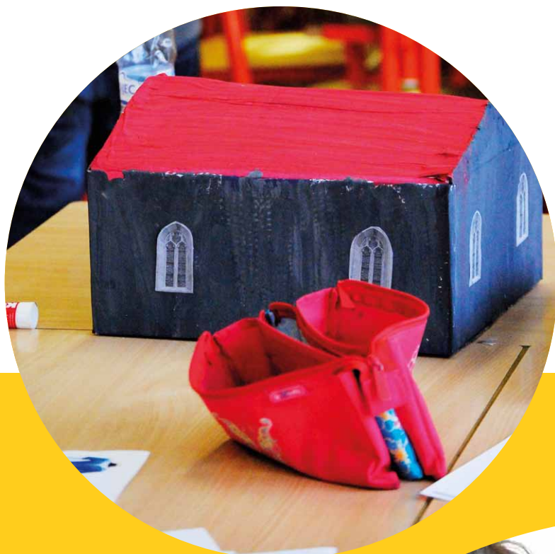
Žáci 7. třídy ZŠ Angel zapojení do projektu Kreativní partnerství pro rovné příležitosti

Rodiče a jejich zapojení do projektu je jednou ze zmiňovaných aktivit v plánovacích formulářích většiny tříd. V Anglii měl projekt velký dopad i na rodiče – hlavně díky větší informovanosti rodičů o tom, co jejich děti v rámci výuky dělají. I v případě pilotního projektu došlo k tomu, že děti rodičům více vyprávěly o aktivitách ve škole. Díky tomu se podařilo zvýšit povědomí rodičů o výuce.